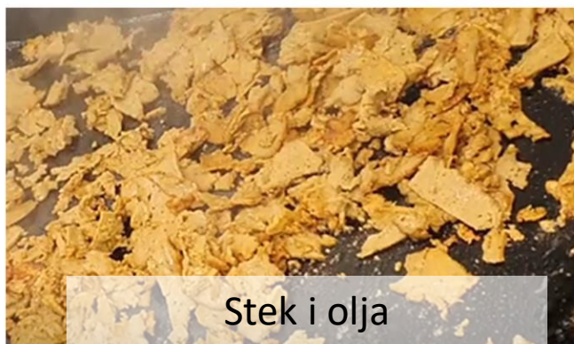
Stek i olja