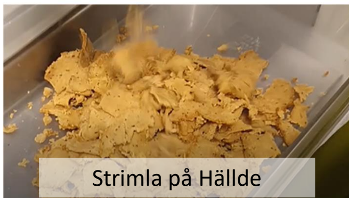
Strimla på Hällde