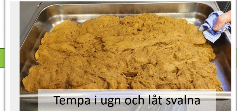
Tempa i ugn och låt svalna