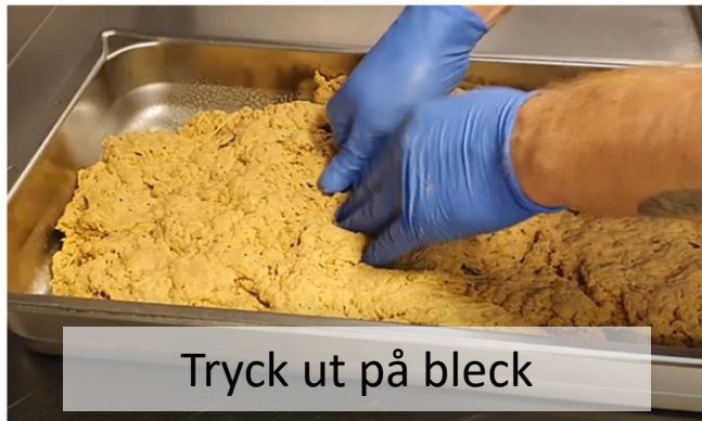
Tryck ut på bleck